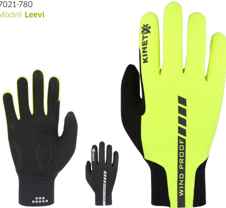
7021-780 Modell Leevi