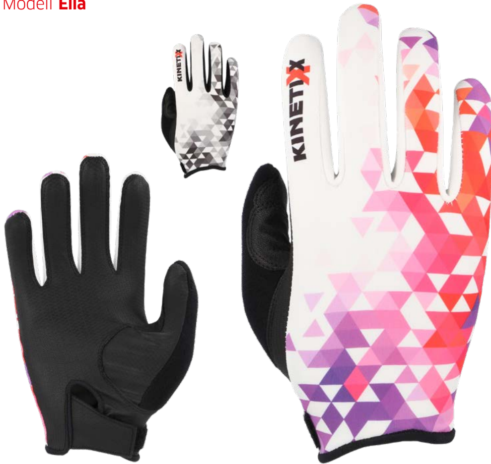
7022-300 Modell Ella